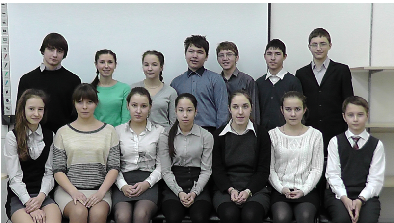
Призеры муниципального (городского) этапа Всероссийской олимпиады школьников 2013-2014 года (7-8 классы)