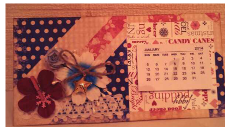
Одна из многочисленных открыток, сделанных руками Насти Мошкиной