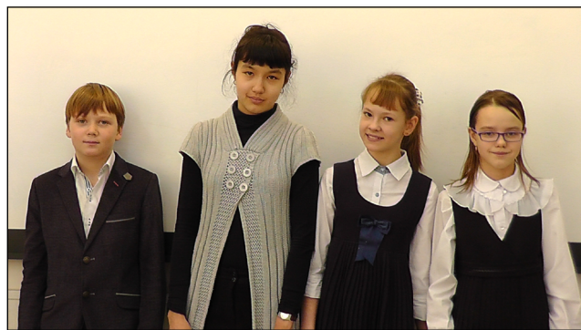
Победитель и призеры муниципального (городского) этапа областной олимпиады (5-6 класс)